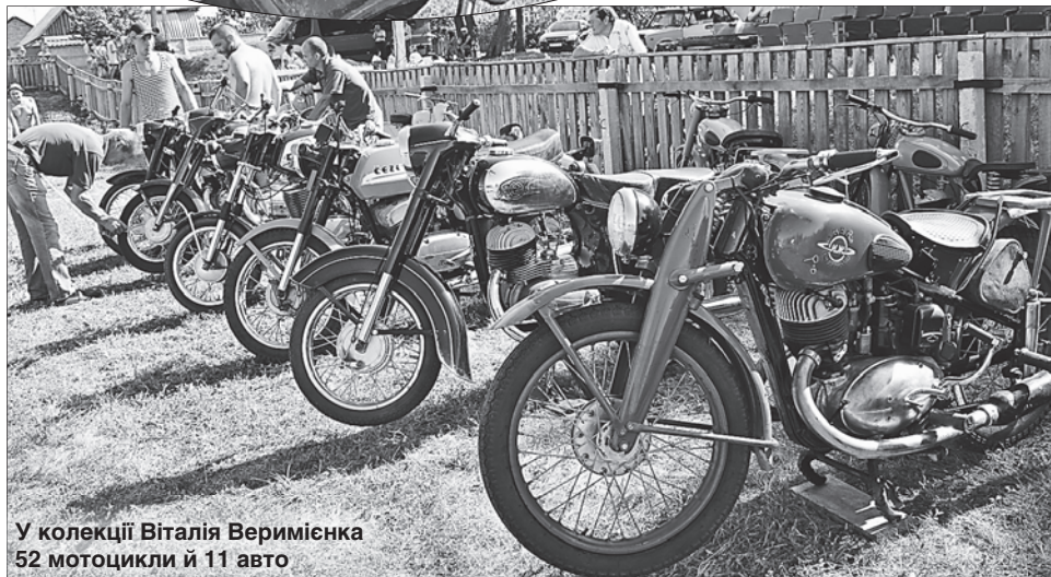
У колекції Віталія Веримієнка 52 мотоцикли й 11 авто