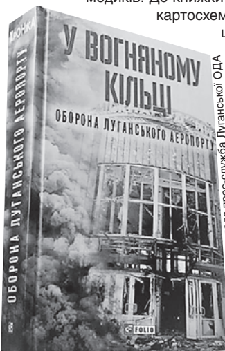
Книгу спогадів «У вогняному кільці. Оборона луганського аеропорту» спершу презентували на Львівщині, де вона й вийшла друком

Книжка — підсумок першої спроби проаналізувати свідчення безпосередніх учасників однієї з найтрагічніших операцій початку російсько-української війни, що досі залишається маловідомою для більшості українців. У документальній хроніці описано не лише події, пов'язані з обороною міжнародного аеропорту «Луганськ» та прилеглих населених пунктів (квітень — початок вересня 2014 року), а й ті, що передували окупації Луганська (зима — весна 2013—2014 років). Книжка містить коментарі військових дослідників, офіцерів та експертів з аналізом основних подій, а також перелік загиблих українських бійців із різних підрозділів.