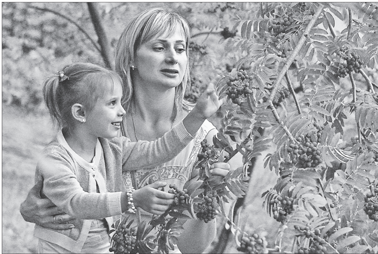
Насолоджуємося теплом бабиного літа й осіннім різнобарв'ям!

НАРОДНІ ПРИКМЕТИ. Якщо горобина вродила рясно, осінь буде вологою, а зима суворою