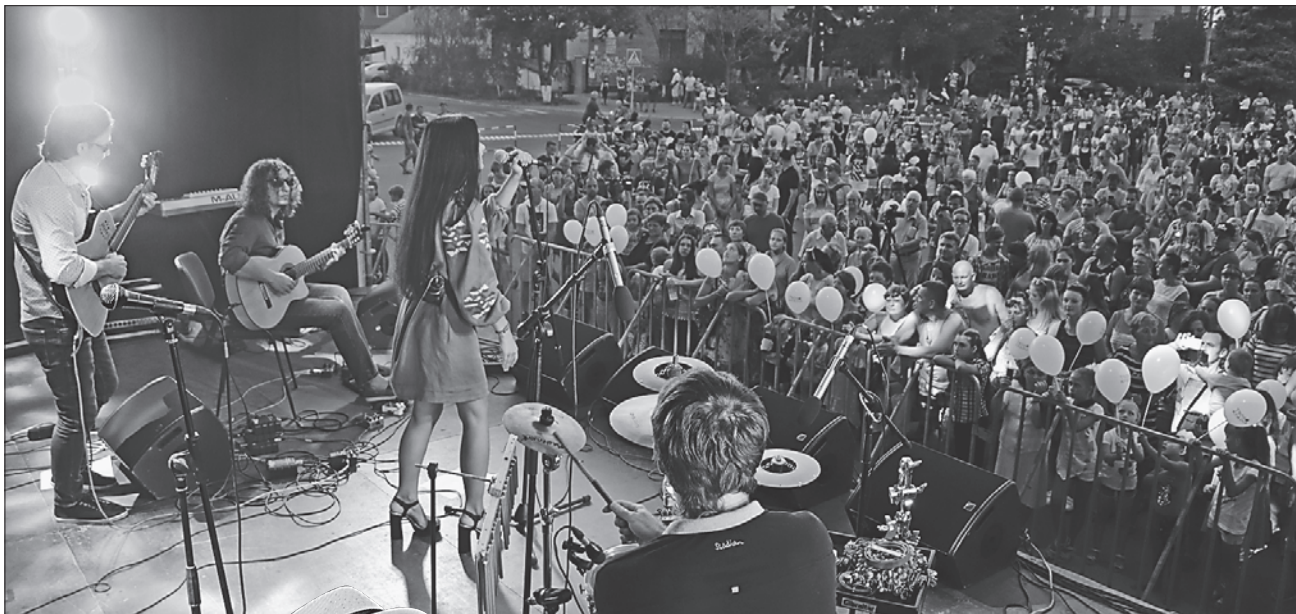
Сотні жителів та гостей міста щиро приймали музикантів