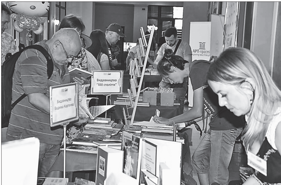
Усі, хто завітав на книжну толоку в Северодонецьку, просили відкрити в місті українську книгарню