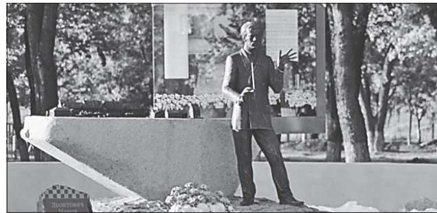
Такий вигляд має пам'ятник відомому українському композиторові Миколі Леонтовичу

Як уже писав «УК» про реалізацію цього проекту, пам'ять великого українця тут вирішили вшанувати тому, що Микола Леонтович у 1904—1908 роках жив і працював у Гришиному (стара назва міста). Тут він викладав музику і співи у школі залізничників та організував хор з місцевих робітників. На згадку про той період у скульптурній композиції є зображення залізничного вокзалу та школи.