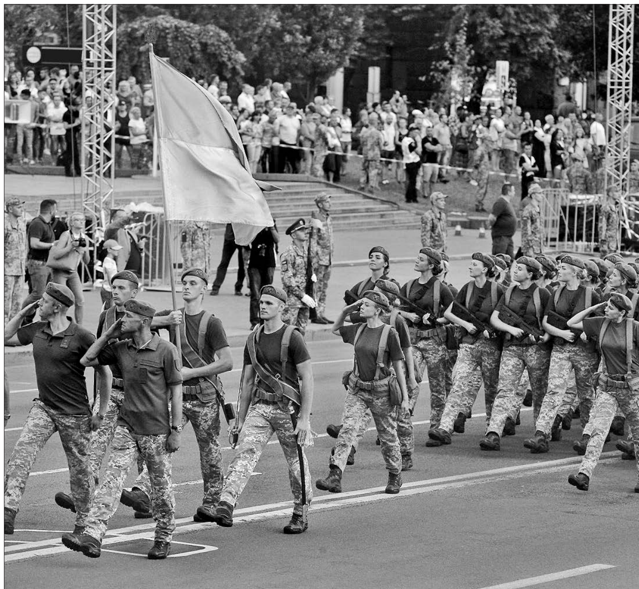
24 серпня наші воїни пройдуть урочистим маршем головною вулицею столиці, показуючи всьому світові: нашу Батьківщину є кому захистити!