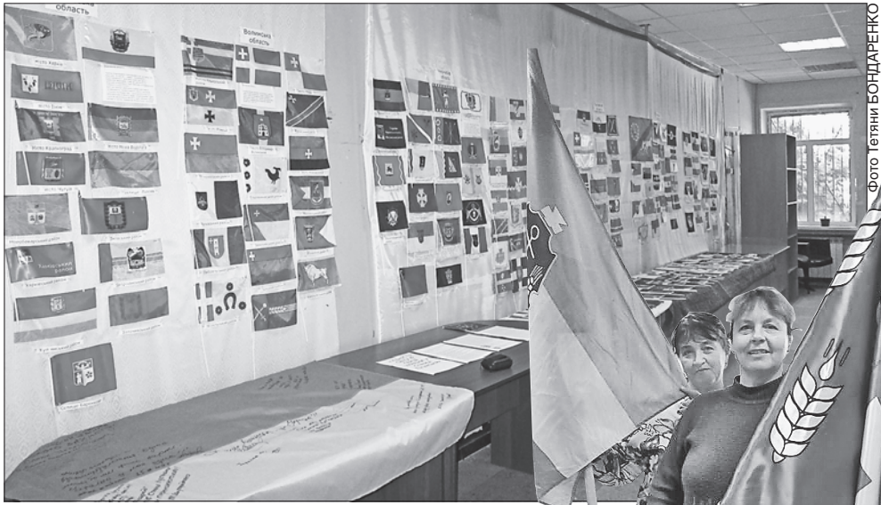
Працівники краєзнавчого музею із радістю приймають поповнення колекції прапорів

СИМВОЛ ДЕРЖАВИ. У музеї Станиці Луганської є унікальна колекція, яка поповнюється