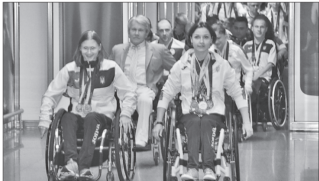
Українські паралімпійці стали найкращими у Європі