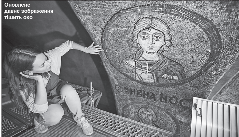
Оновлене давнє зображення тішить око

Закінчити реставраційні роботи, які виконує науковореставраційна майстерня заповідника, планують до кінця року. Кошти надав Кіпрський благодійний фонд.