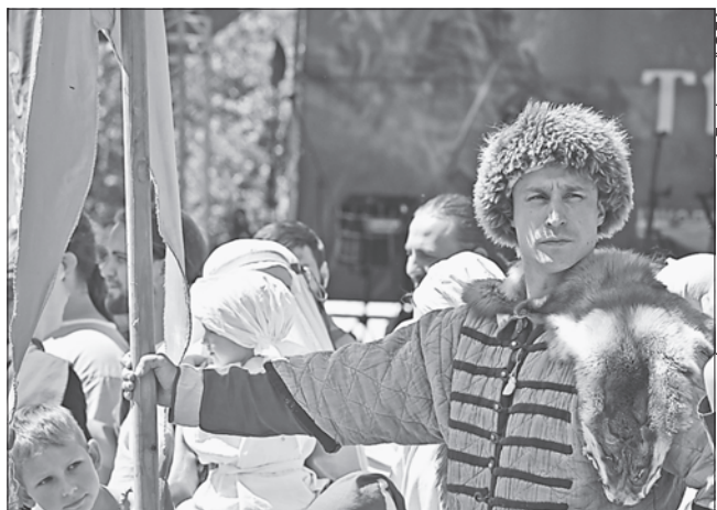
Гості фестивалю могли подивитися історичні бої, повчитися у лицарській школі і спробувати власні сили

МИНУВШИНА Й СЬОГОДЕННЯ. Нинішнього серпня в українських Карпатах фестивалю «Тустань!» організували втринадцяте. Захід відбувався на семи локаціях. Тут були ристалище, ремісничі майстер-класи, театр, університет, духовна територія, літературний клуб тощо.