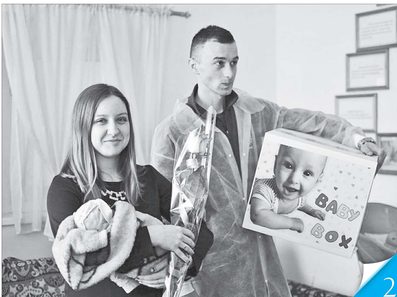
Такі бейбі-боксі вже почали видавати в Івано-Франківську

ТУРБОТА. З 1 вересня після народження дитини кожна родина отримуватиме від держави спеціальний дитячий набір