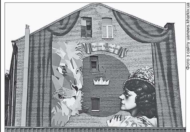
Не малюнок, а витвір мистецтва