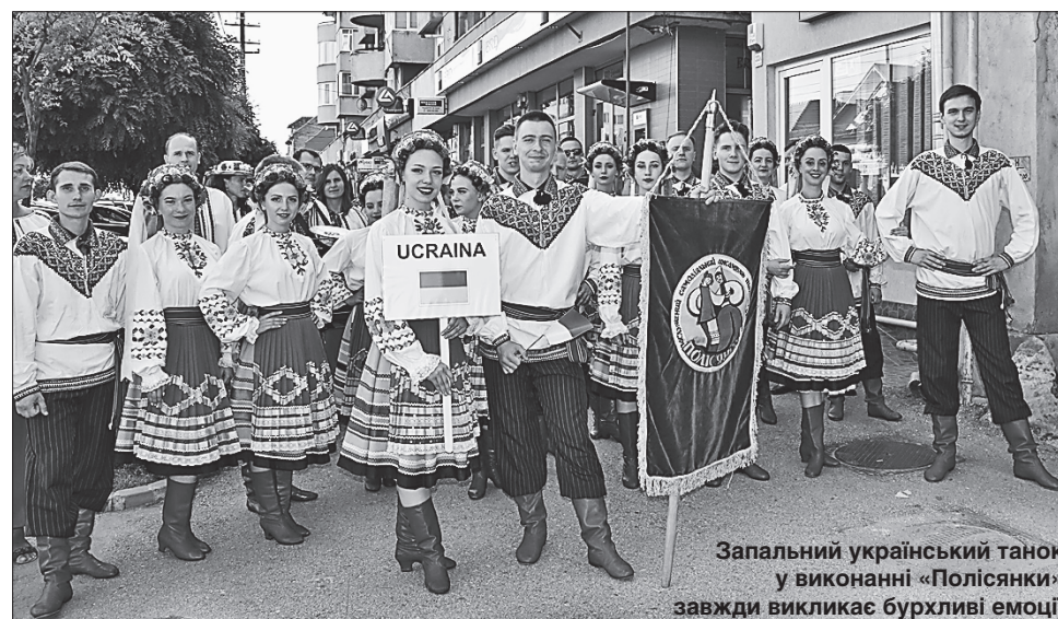
Запальний український танок у виконанні «Полісянки» завжди викликає бурхливі емоції

Крім традиційних гопака та перепілоньки, знана по всіх усядах «Полісянка» представила й прем'єру — «Козаки гуляють». Ми всі дуже турбувалися: композиція, в якій задіяні самі чоловіки й тільки одна дівчина, побудована на непростих трюках. Та хвилювалися дарма: танець був неймовірно й викликав у глядачів не менше емоцій, ніж