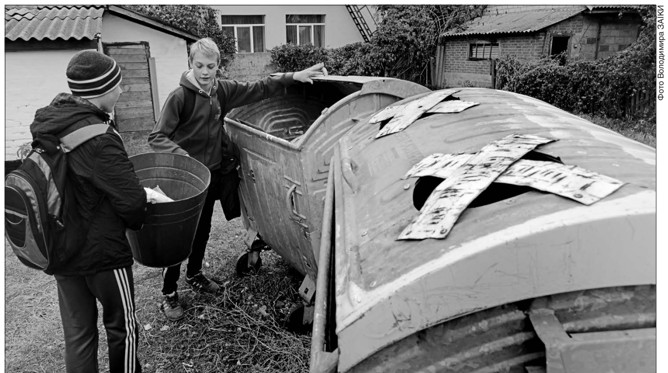
Для виконання норми закону про обов'язкове розділення сміття в Україні катастрофічно не вистачає контейнерів: Іван киває на Петра, а Петро на Івана...

ПОГЛЯД НА ПРОБЛЕМУ. Зусилля влади впорядкувати ринок сміття можуть наразитися на запеклий опір чорного бізнесу