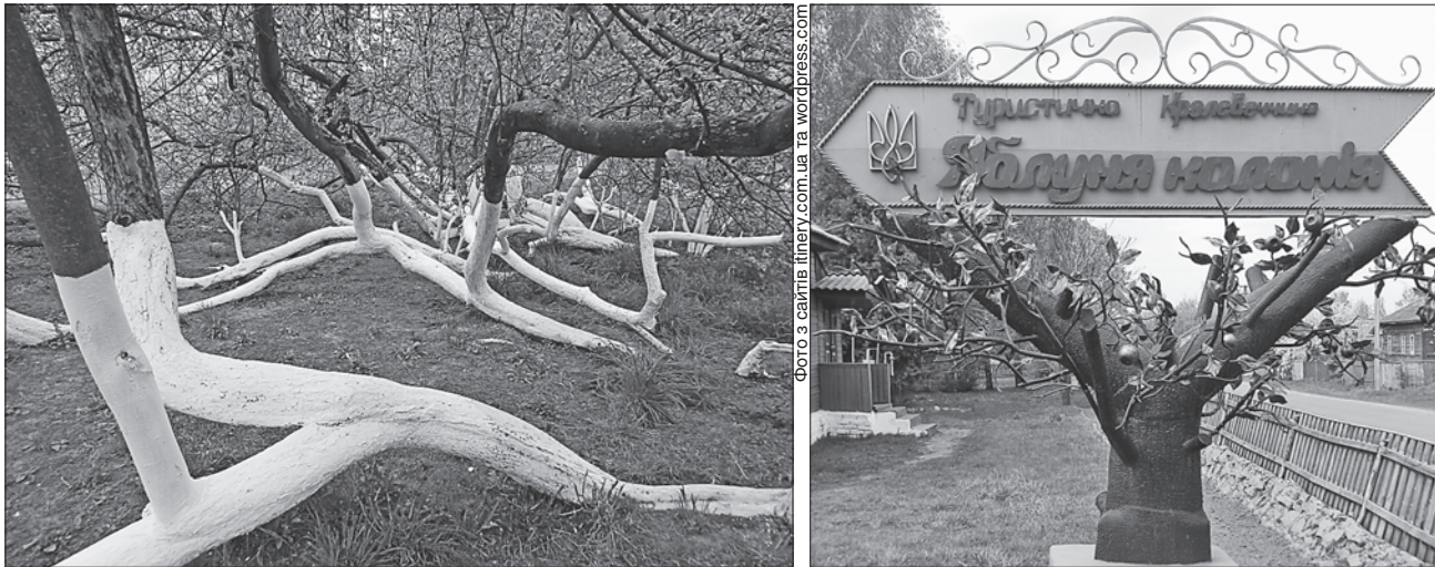
Дивовижна яблуня-колонія росте у Кролевіці: дерево займає площу 10 соток