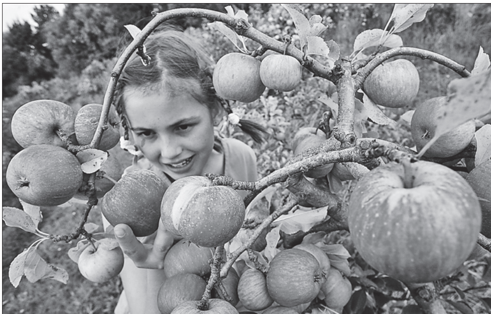
Напрочуд духмяні яблука вродили цього року!

І до сьогодні жоден учений не зміг розгадати кролевецького феномену. Зрештою, ніхто і не наполягає на цьому, аби лишень яблуня цвіла і плодоносила.