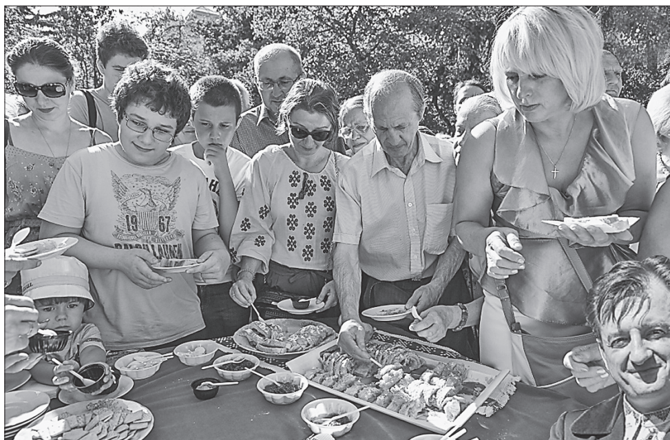
І наче сам господар Іван Франко пригостив гостей духмяними грушами із власного саду, штруделем і різними смаколиками