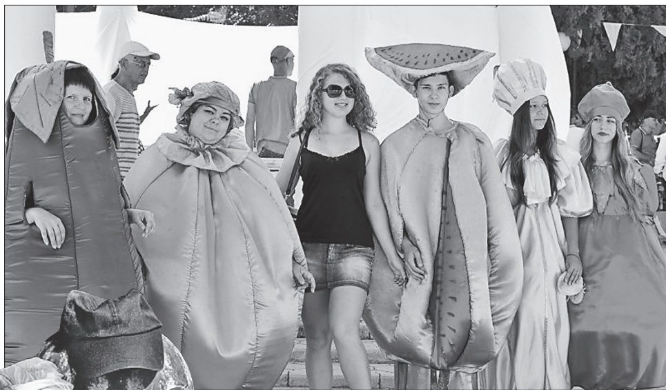
Традиційне свято кавуна у Голій Пристані з розвагами на будь-який смак вдалося!

ФЕСТИВАЛЬ. У місті Гола Пристань Херсонської області відбувся 15-й Всеукраїнський фестиваль «Український кавун — солодке диво». Цього року участь у заході взяли понад 30 фермерських господарств. Усі вони представили кавуни, гарбузи, дині, виноград та іншу власну продукцію. У межах фестивалю проведено виставки-продажі сільськогосподарської продукції та продукції переробної