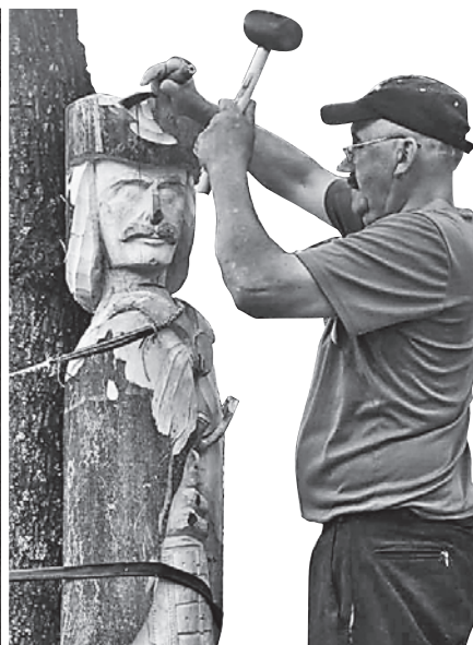
Учасники приступили до роботи