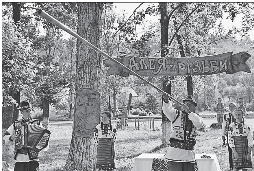
Мить урочистого відкриття