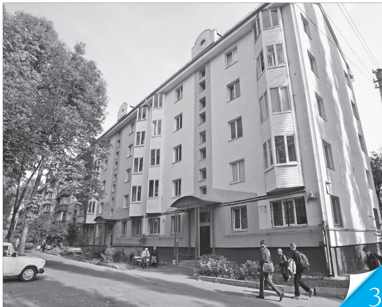
Ось такий вигляд мають після реновації будинки, зведені в 60-ті роки минулого століття

ЖИТЛОВЕ ГОСПОДАРСТВО. Попередні проекти реконструкції застарілого житла в українських містах виявилися мертвонародженими, новий має бути дієвішим