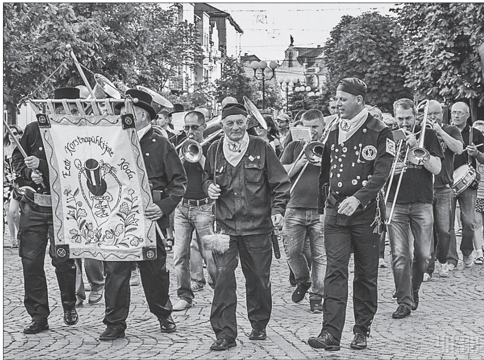
Разом з гостями із Будапешта і Таллінна закарпатські сажотруси в робочих костюмах та з традиційними знаряддями праці пройшли вулицями Мукачеве

Для участі в параді сажотрусів до міста над Латорицею приїхали колеги з Будапешта, Таллінна та Львова. Учасники дійства в робочих костюмах та з традиційними знаряддями пройшли вулицями міста, а також влаштували майстер-клас, на якому охочі дізналися про історію виникнення професії сажотрусів та особливості їхнього ремесла. Кожен зміг потерти гудзика на пам'ятнику сажотрусу на удачу, а також загадати ба-