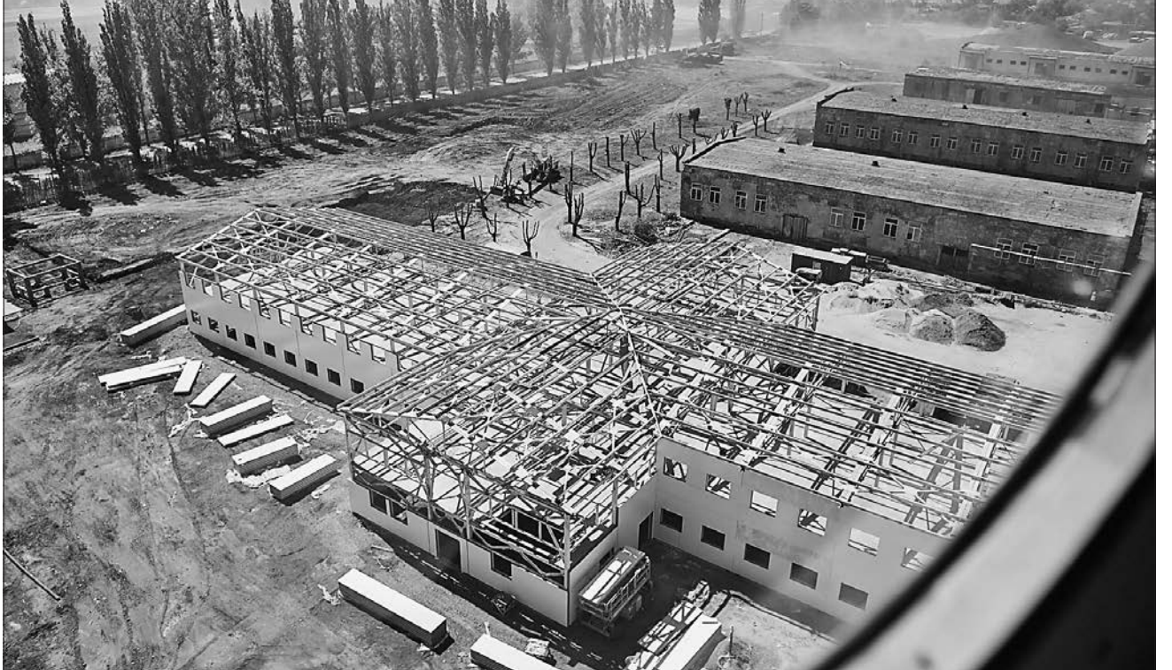
Будівництво військового містечка в Одеській області для окремого батальйону морської піхоти командування Військово-Морських сил ЗСУ