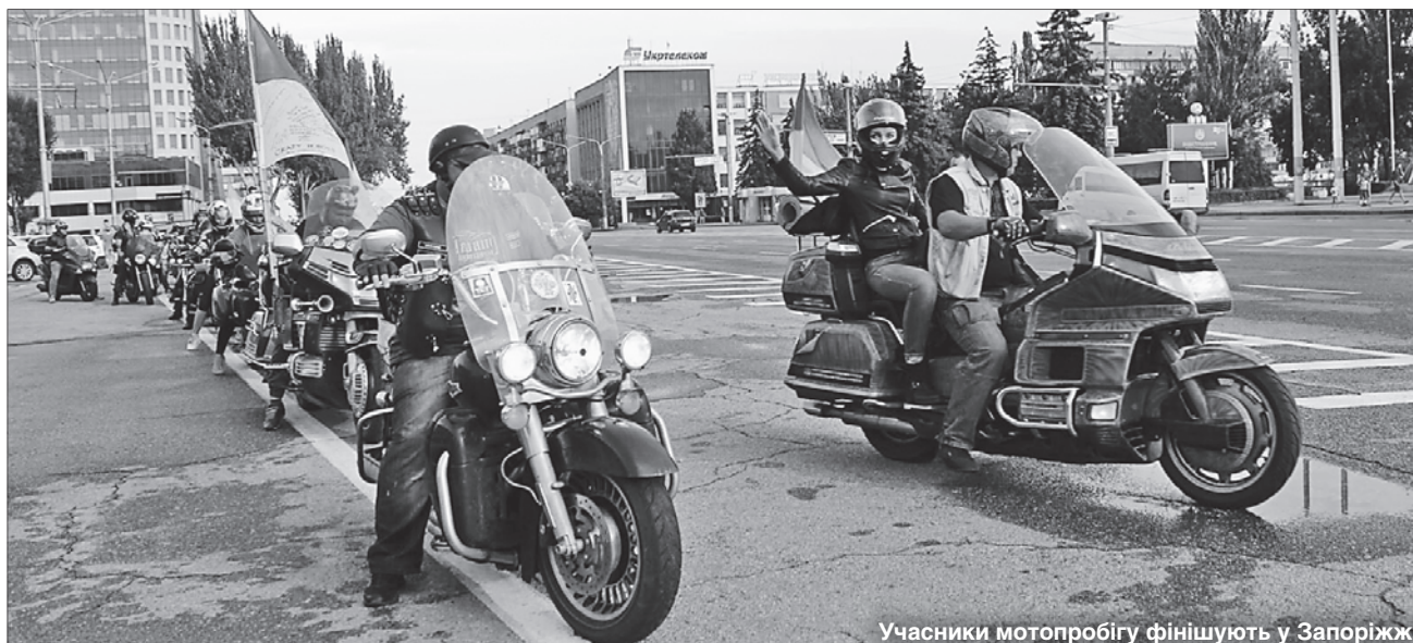
Учасники мотопробігу фінішують у Запоріжжі