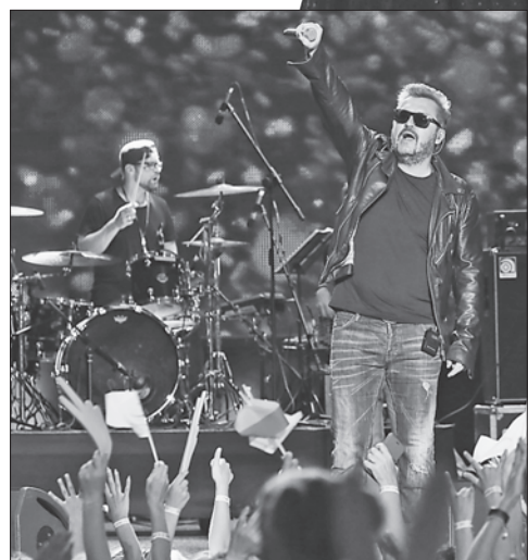
Фестиваль тривав у курортному Скадовську протягом трьох днів

випускний клас. Продовжуємо нашу історію і бачимо свою місію в тому, щоб допомагати дітям. Цей фестиваль — чудовий майданчик для реалізації творчих амбіцій конкурсантів. Тут вони мають змогу здобути досвід, відвідати май-