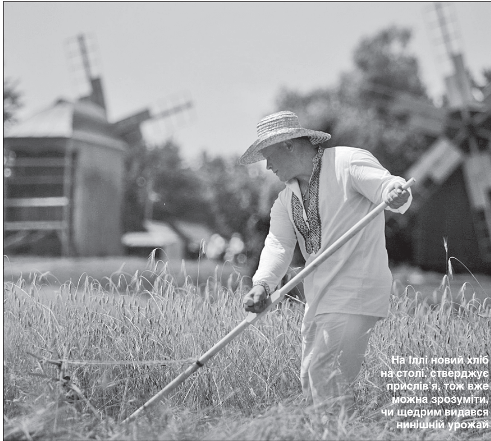
На Іллі новий хліб на столі, стверджує прислів'я, тож вже можна зрозуміти, чи щедрим видався нинішній урожай

За народним повір'ям, після Іллі не можна купатися в річці, особливо дітям. Температура у во-