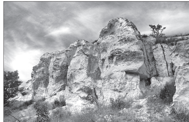
Красиви природних розламів крейдяних гір Донецького кряжа можуть зацікавити туристів

Сільський туризм — чинник позитивного іміджу та джерело доходів для територій, упевнені у департаменті економічного розвитку, торгівлі та туризму Луганської ОДА. Таке питання обговорювали на спеціальній нараді, де туристський потенціал своїх територій презентували представники восьми об'єднаних територіальних громад області.