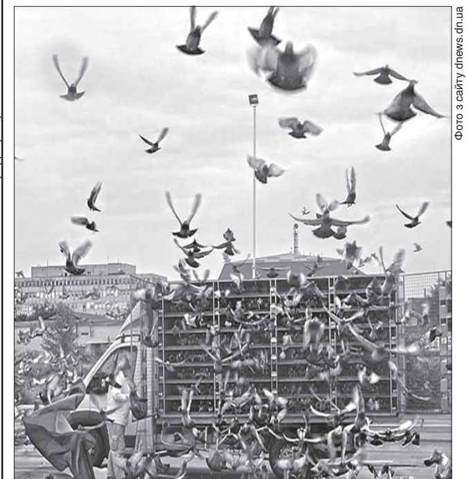
Нехай голуби несуть мир на Донбас!

Як повідомляє відділ комунікації поліції Луганської області, за випуском птахів миру спостерігали громадські активісти, жителі Северодонецька та інших міст і районів Луганщини. А потім голуби полетіли по своїх домівках у різні куточки Румунії. Українські активісти кажуть, що відзначать усі міста, з яких завітали до них такі чудові гості.