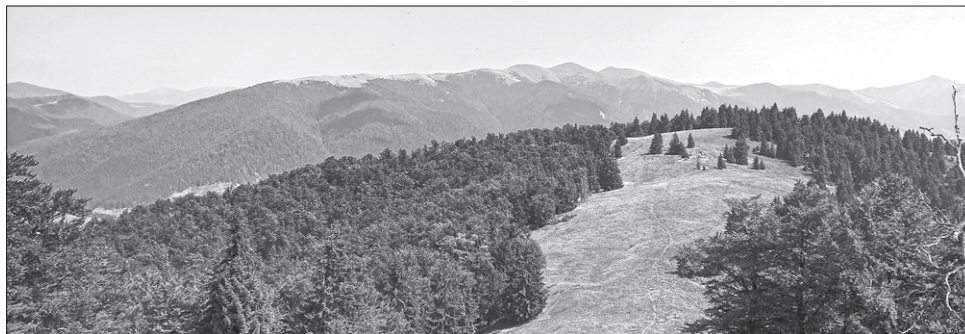
У Національному природному парку «Синевир» і гарні краєвиди, і добрі умови життя диких тварин

Раніше ці тварини перебували в одному із зоопарків Харкова, а тепер їх прийняла гостинна карпатська земля. Ту-