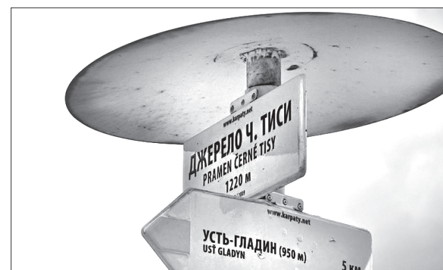
Знак, що вказує на місце витoku Тиси

Тут встановлено рекреаційні об'єкти, інформаційні стенди. Закарпатські лісівники прикрасили місцину дерев'яними скульптурами. Торік восени силами Закарпатського обласного управління лісового та мисливського господарства поблизу витoku Чорної Тиси побудували лісову дорогу, яка сполучає Тячівський і Рахівський райони області та скорочує шлях між ними з 210 до 22 кілометрів. Тож їздити тут стало набагато зручніше.