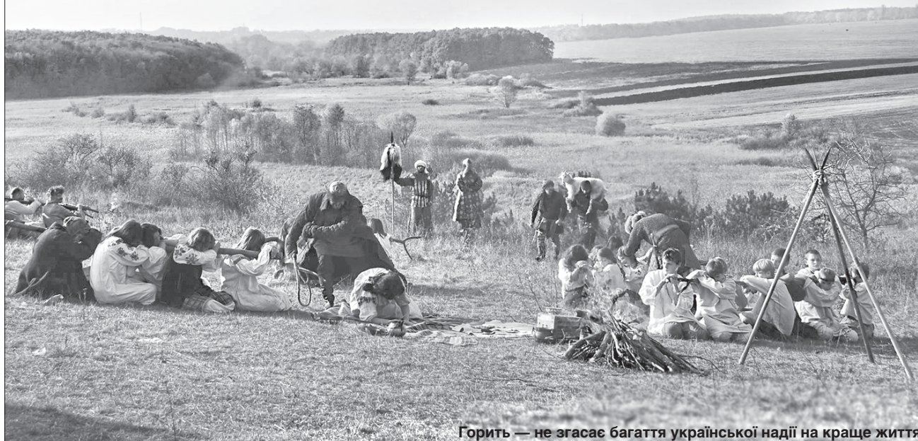
Горить — не згасає багаття української надії на краще життя