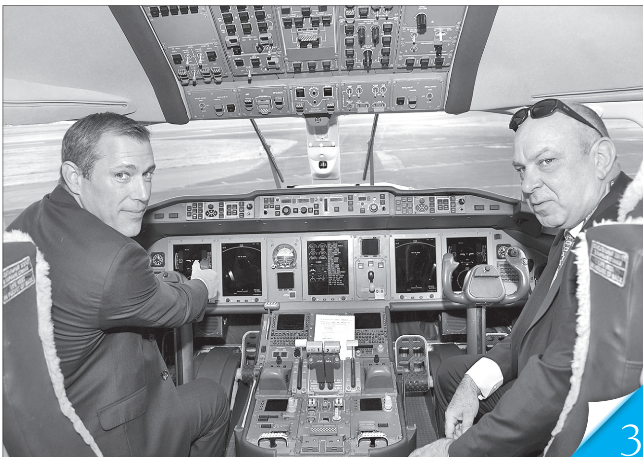
Президент Aviall Services, Inc. Ерік Страфел і президент ДП «АНТОНОВ» Олександр Донець (праворуч) в салоні Ан-178

ФАРНБОРО-2018. На авіасалоні українці уклали угоду з американською компанією та визначили напрями співпраці з літакобудівниками Швейцарії й Туреччини