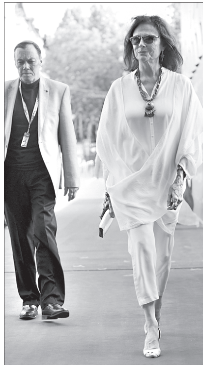
Спеціальну гостю кінофестивалю британську актрису Жаклін Біссет було відзначено «Золотим Дюком» за внесок у кіномистецтво