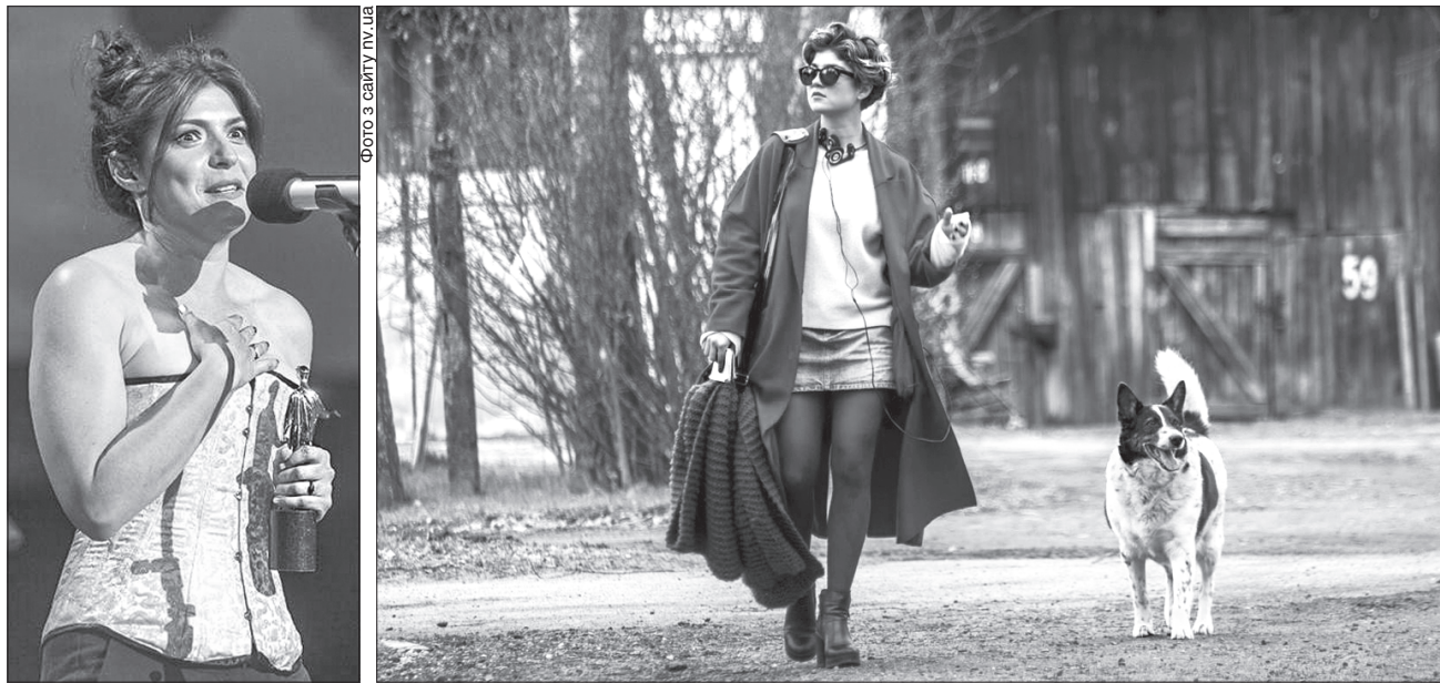
Гран-прі 9-го Одеського міжнародного кінофестивалю шляхом глядацького голосування отримав фільм «Кришталь» (кадр з фільму — праворуч) режисера Дар'ї Жук (на фото ліворуч)

ПОДІЯ. Кіномитці запевняли, що із задоволенням повернуться в Україну для зйомок нових фільмів