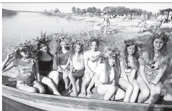
Різноманітні заходи розширили світогляд дітей і залишили яскраві враження