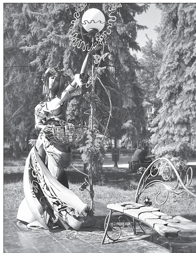
Приклад Житомира доводить, що межа між дівчиною-весною і бабою з косою — лише у чиновницькій байдужості

Надзвичайна пригода в Житомирі має стати застереженням не лише для житомирських чиновників, бо ніхто не дасть гарантії, що популярні нині металеві паркові скульптури в інших містах України не є аналогом смертоносної дівчини-весни.