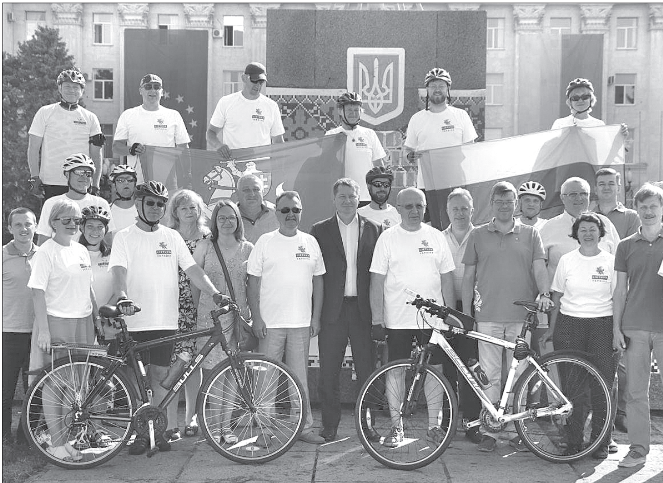
Гостей із дружньої країни щиро зустріли на Херсонщині