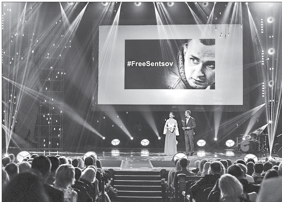
В Одесі не забули про Олега Сенцова: протягом усього фестивального тижня кожному кінопоказу передуватиме ролик, присвячений його долі

Частина громадськості спостерігала за дійством наживо, ще більша — на ТВ та в інтернеті. Користувачі соцмереж не обійшли увагою жодного з учасників дефіле, коментарі були подекуди смішні, подекуди образливі. Так гості червоної доріжки могли відчувати себе справжніми селебриті з усіма плюсами та мінусами народної уваги. Більшість гостей дотримувалася встановленого дрес-коду black tie. Були помічені й деякі порушники. Зоряний гість американський актор Ерік Робертс з'явився в демократичних блакитних джинсах, які виокремлювалися на загальному тлі. Актор, жартуючи, перепрошував, що готується до чергової ролі, і з охотою фотографувався разом із шанувальницями.