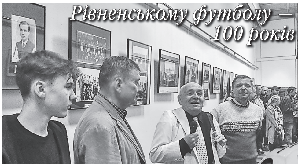
Долучитися до історії обласного футболу змогли і ветерани спорту, і молодь