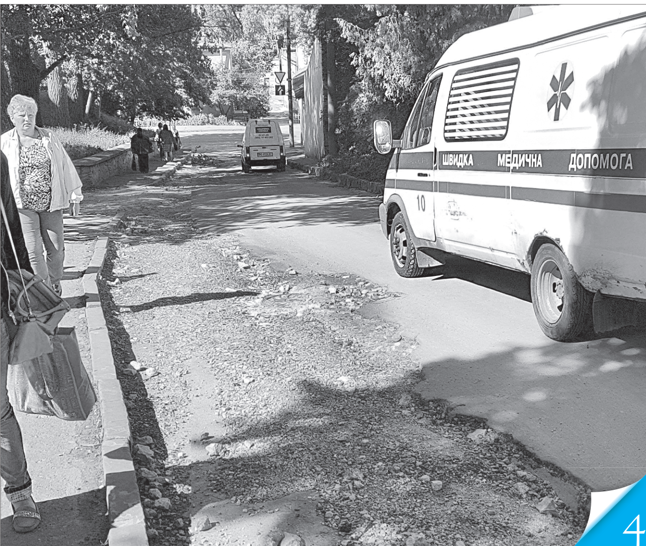
Під'їзди до станцій швидкої допомоги у Тернополі не витримують критики

ДОРОГИ І ТРИВОГИ. «Урядовий кур'єр» дізнавався, в якому стані під'їзні шляхи до лікарень у різних регіонах країни