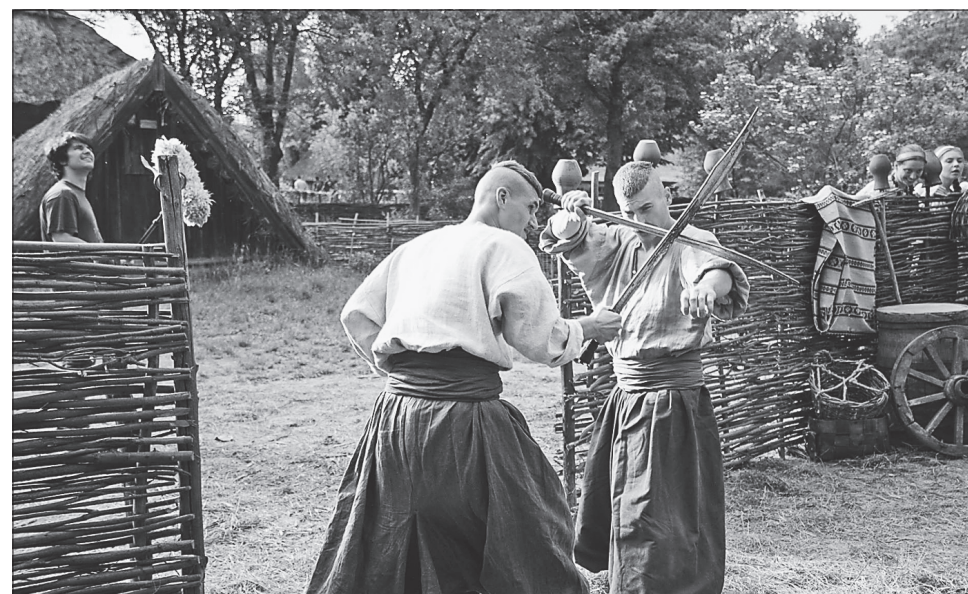
На Черкащині тривають зйомки фільму-казки про народного захисника — українського козака

Козацький рід існує на світі доти, доки в ньому народжуються козаки-лицарі, які захищають свою землю від ворогів-нападників. А козакам, які поклали свої голови в бою, прощаються всі гріхи. Розлучений