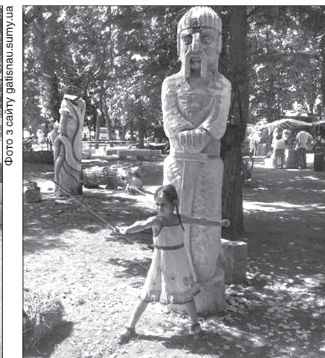
Учасники фестивалю різьбярів творили і прикрашали місто одночасно