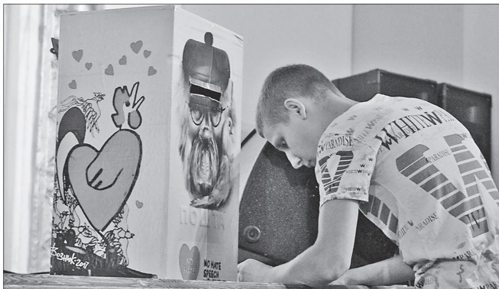
Гості арт-акції мають змогу написати свої побажання та привітання й покласти їх у скриньку «Пошти добра», автори найоригінальніших з них отримають символічні призи