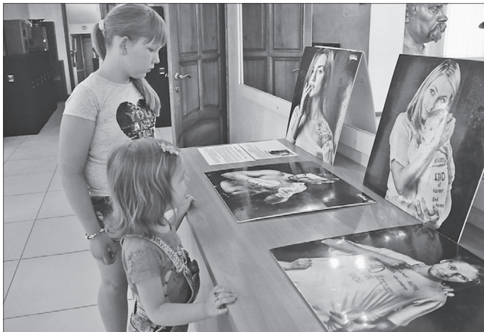
Емоційні фотографії Леоніда Шевчука привертають увагу глядачів різного віку