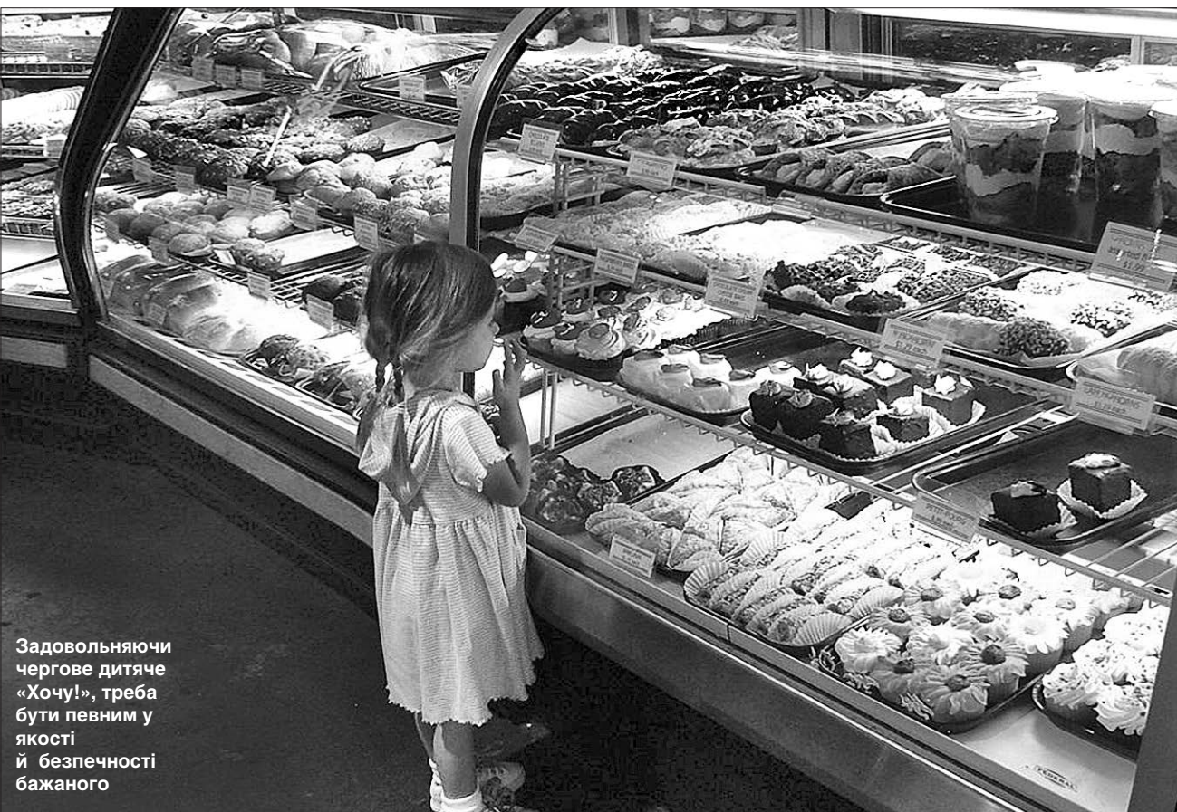
Задовольняючи чергове дитяче «Хочу!», треба бути певним у якості й безпечності бажаного

БІОБЕЗПЕКА. Чи можна запровадити в нас систему пест контролю світового зразка, якщо ні виробники, ні державні структури до цього не готові?