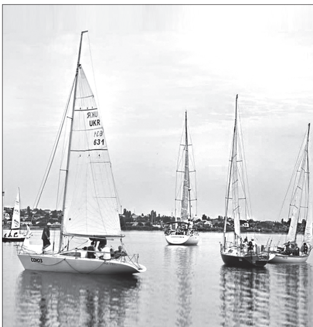
Регата «Кубок Кінбурнської коси ім. Сергія Шаповалова» стала для регіону важливим екологічним заходом