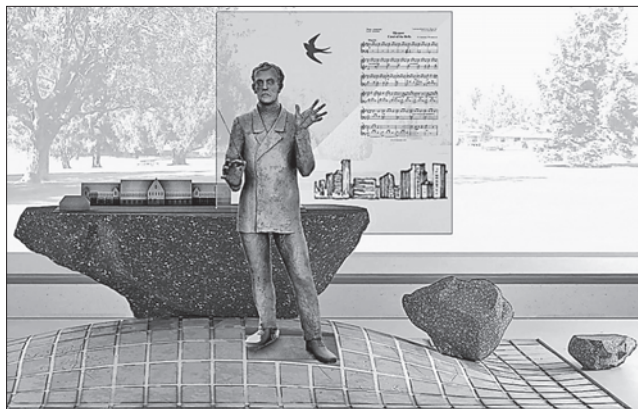
Проект скульптури композитора в міському парку

ВШАНУВАННЯ. У Покровську на Донеччині невдовзі встановлять пам'ятник відомому українському композиторові і педагогу Миколі Леонтовичу. Жителі міста мають намір вшанувати автора обробки славнозвічного «Щедрика», «Дударика», «Піють півні» та інших народних пісень, врахувавши те, що він свого часу тут жив і працював. 1904 року Микола Леонтович приїхав до Гришиного (так тоді називався населений пункт), де працював викладачем музики і співав в школі залізнични-