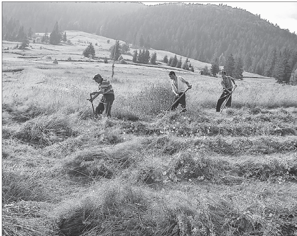
Головна подія липня — сінокос — має свої правила і ритуали

Івана Купайла — найяскравіше молодіжне свято і в наш час. Традиційно у містах і селах його проводять на берегах озер, ставків, річок, біля ритуальних вогнищ. Пісні й танці, жартівливі розваги тривають до півночі. Юнаки й дівчата, взявшись за руки, стрибають через вогонь. Це своєрідний обряд очищення від хвороб, зміцнення сил і здоров'я. Завершується свято романтичним ритуалом з віночками, що їх дівчата пускають на воду. На кожному з них горить свічка долі.