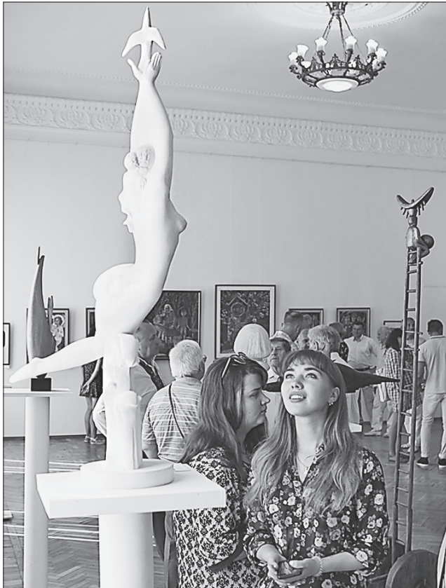
Емоційні скульптури митця завжди викликають захоплення у глядачів

сональних виставок. Автор наукових статей у фахових виданнях та навчально-методичних посібниках. Лауреат обласної премії імені Данила Нарбути та Всеукраїнської премії «Смарагдова ліра» у номінації «Образотворче мистецтво». Автор багатьох меморіальних дощок і десятків відомих пам'яників.