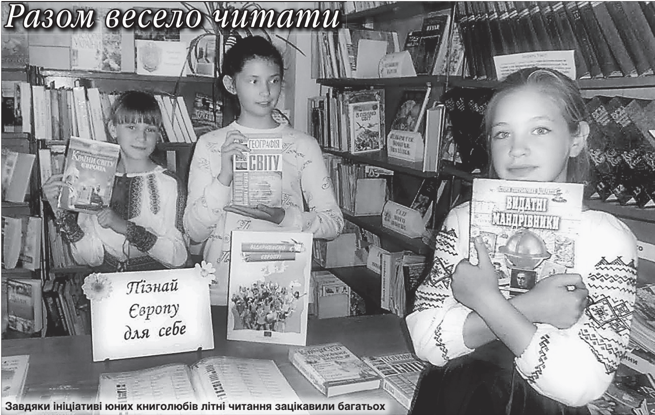
Завдяки ініціативі юних книголюбів літні читання зацікавили багатьох