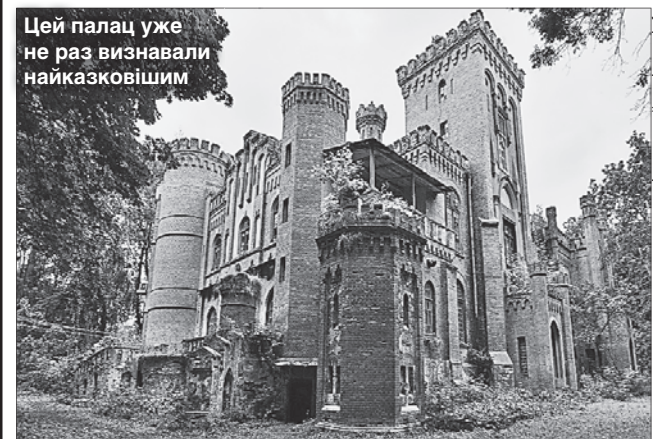
Цей палац уже не раз визнавали найказковішим

Очевидно, вже давно настав час відповідним відомствам подбати про збереження цього унікального замку.