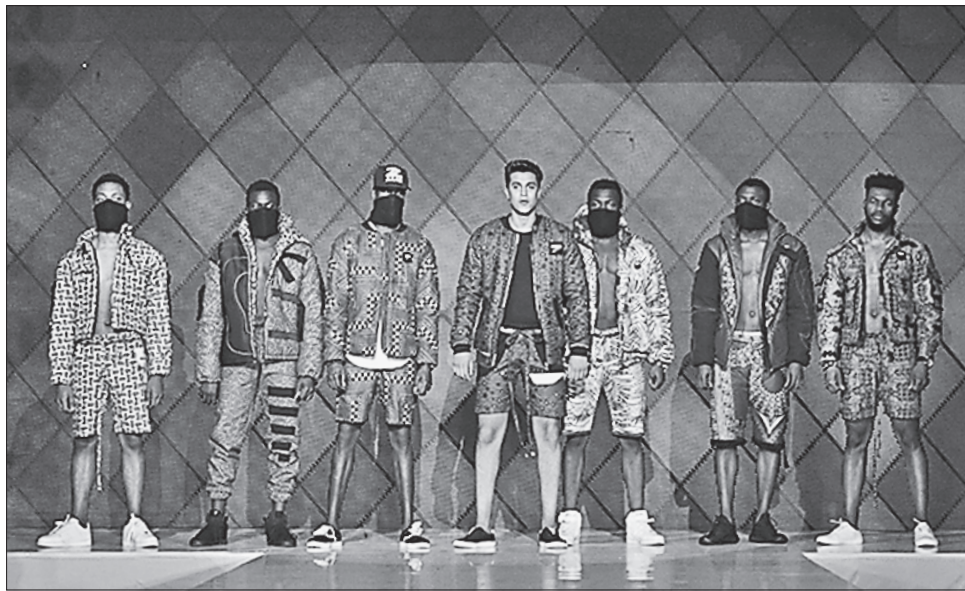
Чоловіки також хочуть бути красивими

«Організація конкурсу, рівень робіт, — ділиться враженнями член журі Анжеліка