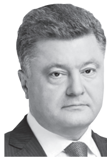
Президент України під час підписання Закону «Про дипломатичну службу»

ПЕТРО ПОРОШЕНКО: «Цей закон робить нашу дипломатичну службу передовою, ефективною, і головне — захищеною та європейською».