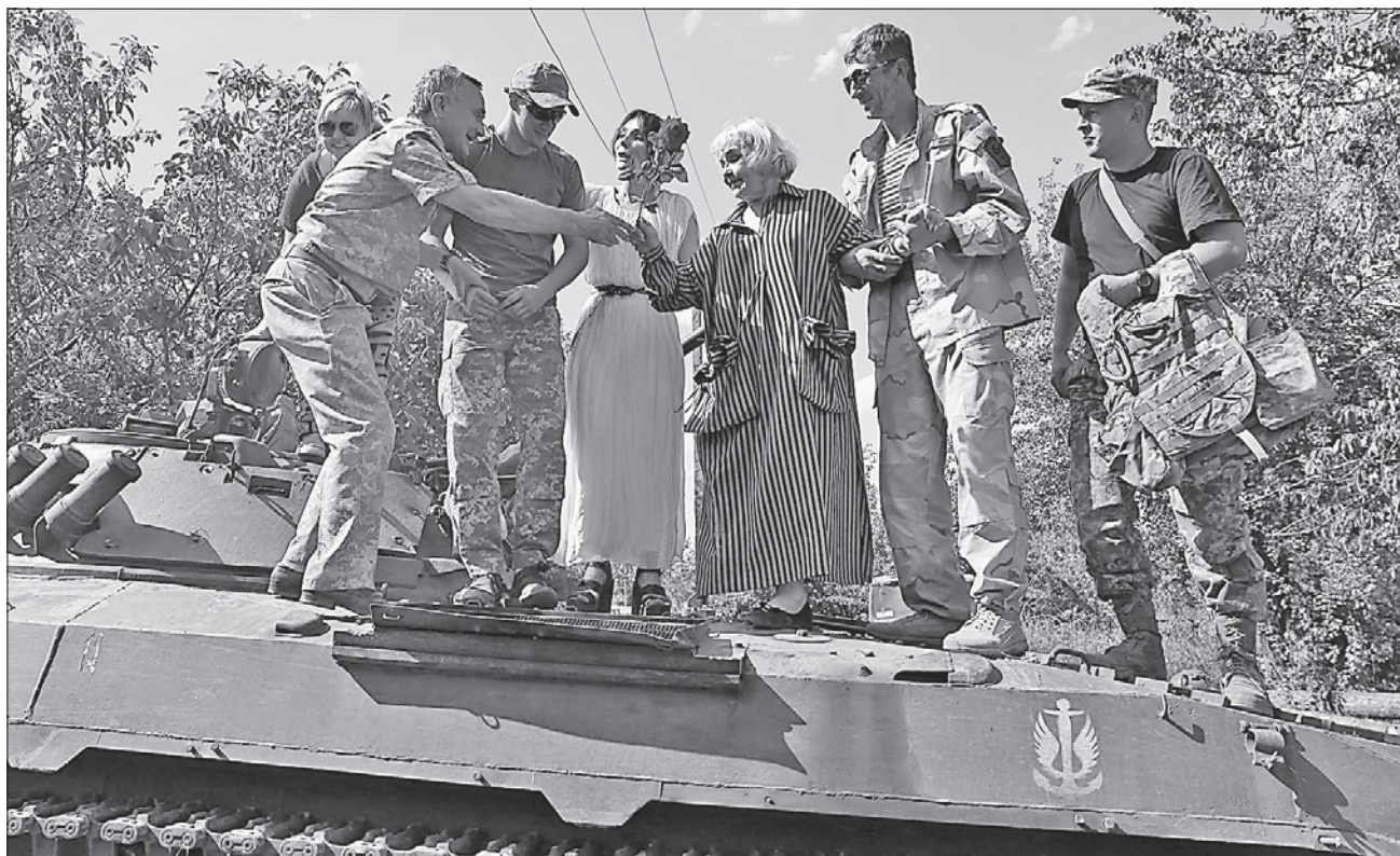
Народна артистка України Ада Роговцева — частий гість на позиціях українських військових