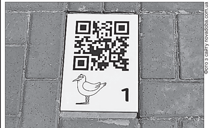
Табличку з QR-кодом автори проекту просять оберегати від пошкоджень

Перший номер у «Крилатій стежці» — Соборна площа. Тож на знак відкриття маршруту представники міської влади й оператора мобільного зв'язку урочисто заклали першу табличку на цьому місці. Загальна довжина маршруту — 4,7 км. Його можна пройти за 2—3 години.