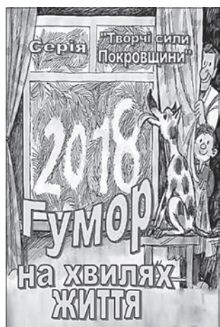
Обкладинку збірника оформив Микола Капуста

лого цеху з інших регіонів. Тут представлена творчість авторів із сусідньої Дніпропетровської області. І завдяки спільним зусиллям читачі отримали гарний подарунок у вигляді щедрої порції усмішок та сміху, які пропонує ця весела книжка, нагадуючи давню істину «Світ вцілів, бо сміятися вмів». У роки гібридної війни, від якої потерпає Донеччина, цей вислів також дуже актуальний. Це вже підтвердили перші читачі книжки.