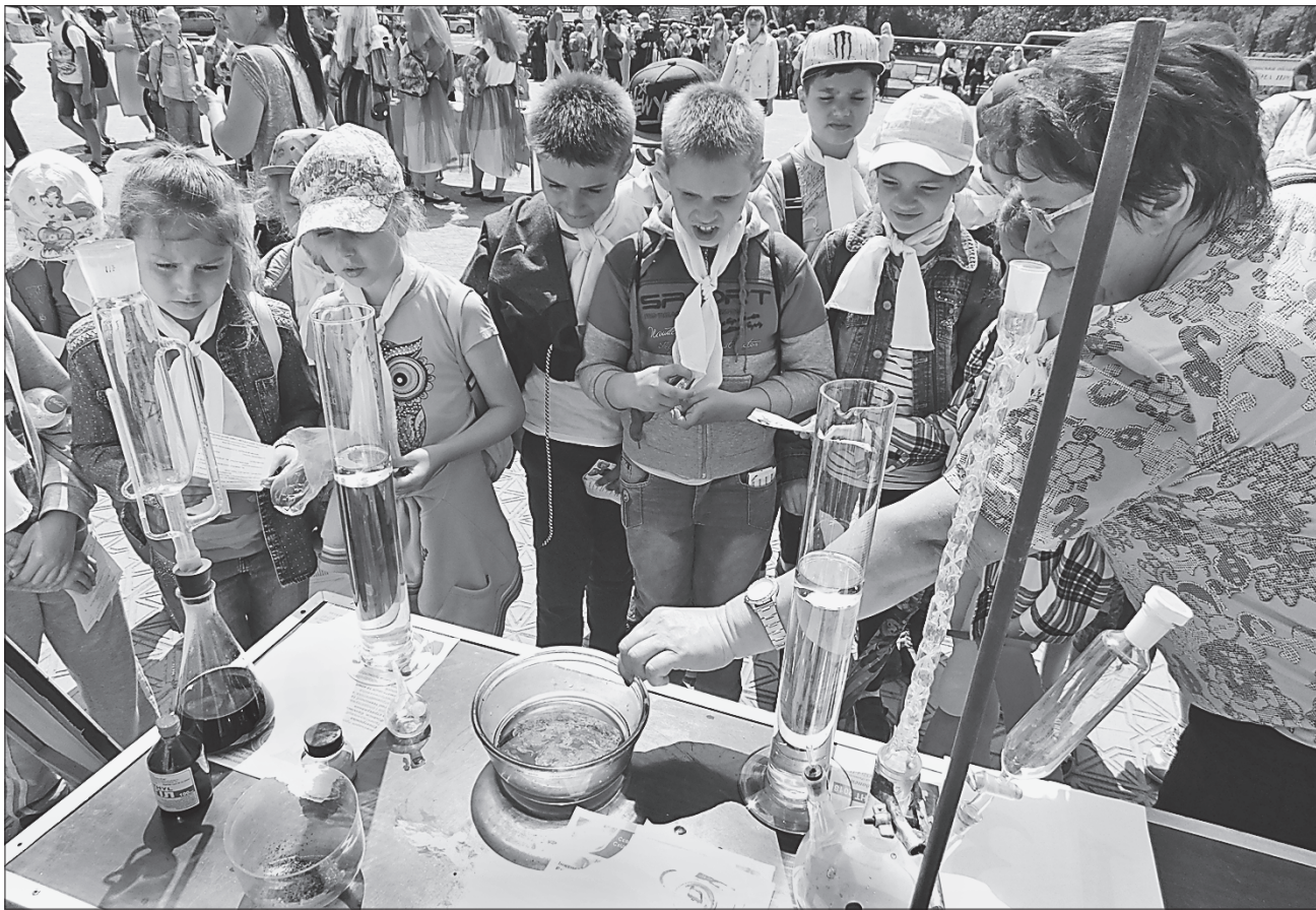
Діти Луганщини у Країні професійних мрій