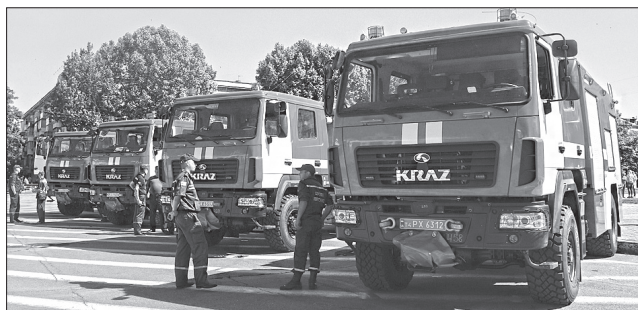
ФОТО НАДАНО АВТОМОБІЛІ

БЕЗПЕКА. Чотири новенькі автомобілі вітчизняного виробництва АЦ4-60(5401)-515K передано херсонським рятувальникам. Голова Херсонської обласної державної адміністрації Андрій Гордєєв повідомив, що «автопарк рятувальників поповнився, що стало важливим кроком для захисту жителів і гостей області від стихії». Нещодавно для гасіння масштабної пожежі в Олешківському лісі було залучено більш як 60 одиниць техніки ДСНС. І тільки 20 з них надала Херсонська область. Тож питання матеріально-технічного забезпечення надзвичайно актуальне, особливо у розпал туристського сезону.