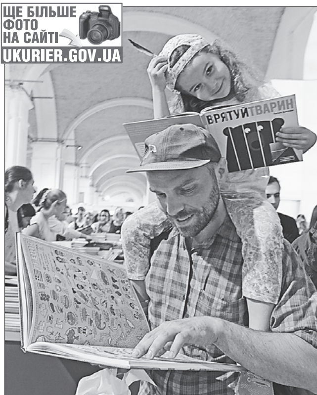
У нас із татом однакові смаки — дитяча література

Проект «Разом — за природу» зазначав, що куплену книжку буде відшкодовано висадженням деревом у Карпатах. Підрахунок вели покушці. На електронному стенді о 16 годині 2 червня з'явилася цифра 23 тисячі, а свято книжки тривало аж до вечора 3 червня.