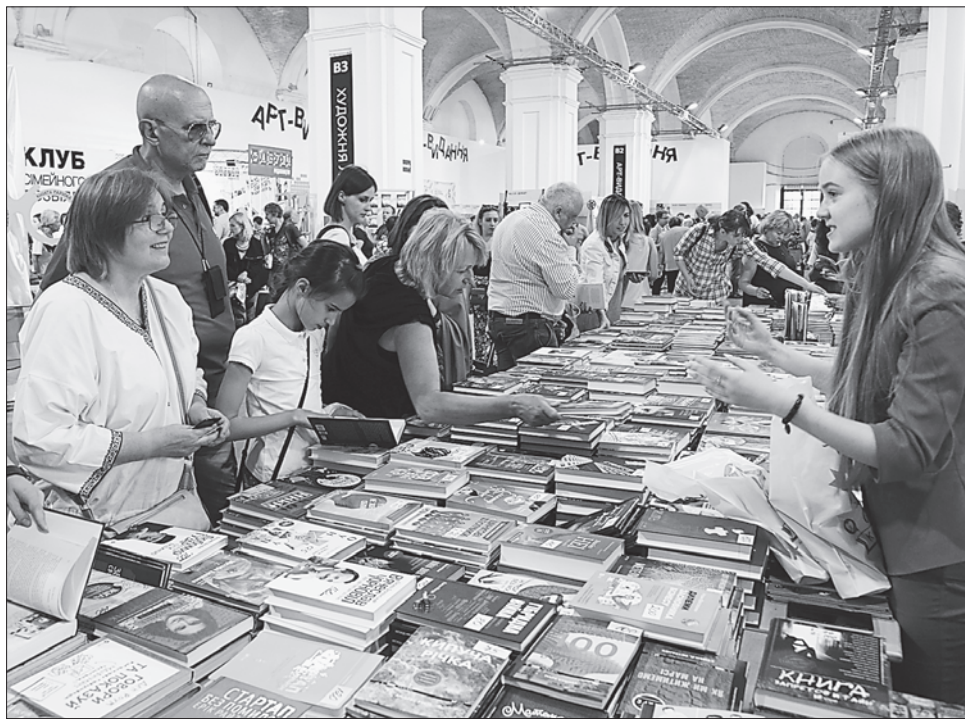
Придбати цікаву книжку тут зміг кожен відвідувач

«Книжковий Арсенал» став інтелектуальним святом читачів з усіма дотичними до видань, зокрема ілюстраторів, дизайнерів, промоутерів. 150 видавництв, 200 українських та 100 закордонних письменників із 31 країни. І 500 заходів. Спеціальний гість — Братиславський книжковий фестиваль BraK. Фокус-тема: «Проект майбутнього» про мрії людства й місце людини у світовому демократичному порядку з гібридними викликами сьогодення. Фахівці розмірковували, як протистояти дегуманізації технологій. На фестивалі діяла інтелектуальна платформа, а також були благодійні, перформативні проекти, вистав-