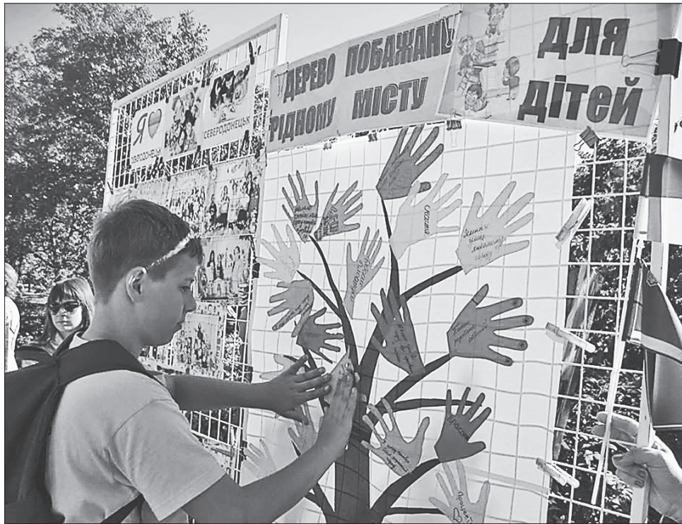
Миттєвості свята міста Северодонецька

Вихідні були дуже яскравими: крім дати заснування міста, тут традиційно відзначали ще й День хіміка. Тож святкова програма вийшла дуже насиченою. Показати свої таланти цими днями северодонецьчани могли і на концерті учнів і викладачів місцевих дитячих музичних шкіл, шаховому турнірі для всіх «Хід конем», чемпіонаті з техніки водного туризму і на змаганні із запуску повітряних зміїв серед учнівської молоді. Свої роботи на суд глядачів представили майстри декоративно-прикладного мистецтва і клубу любителів вишивки «Червона ниточка», а також учні і вчителі дитячої худож-