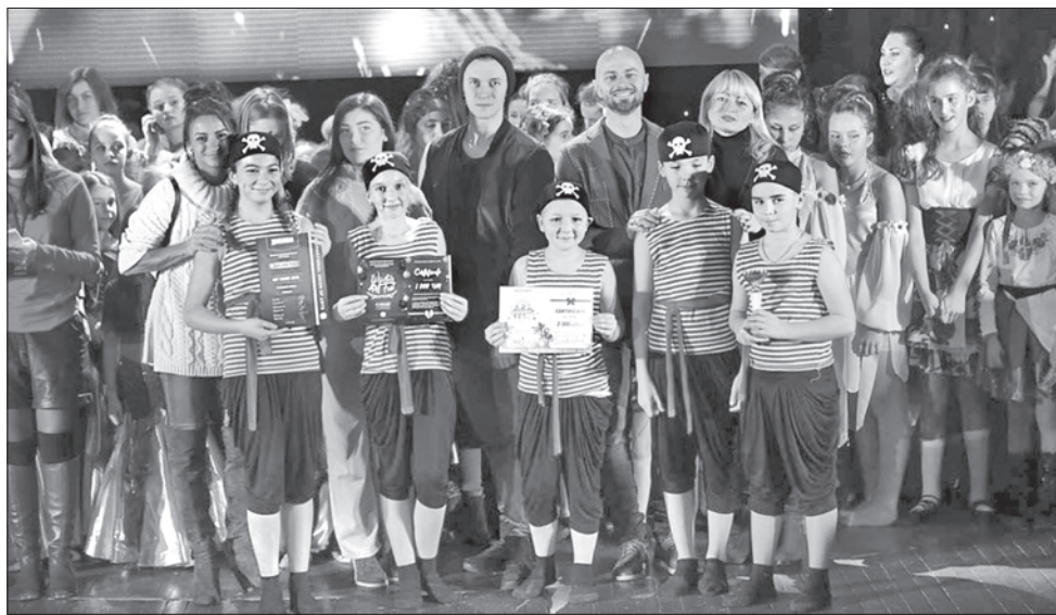
Юних танцюристів з Рівненщини високо оцінили зіркові судді

На стінах танцювальної зали не вистачає місця для нагород, які привозять «Ритми серця» з найпрестижніших конкурсів. Серед них золоті, срібні та бронзові відзнаки з конкурсу ART-dance-2018, який нещодавно пройшов у Львові. У його журі були Влад Яма та Вікторія Гвоздьова. Свої авторитетні голоси зіркові судді віддали юним мирогощанцям.