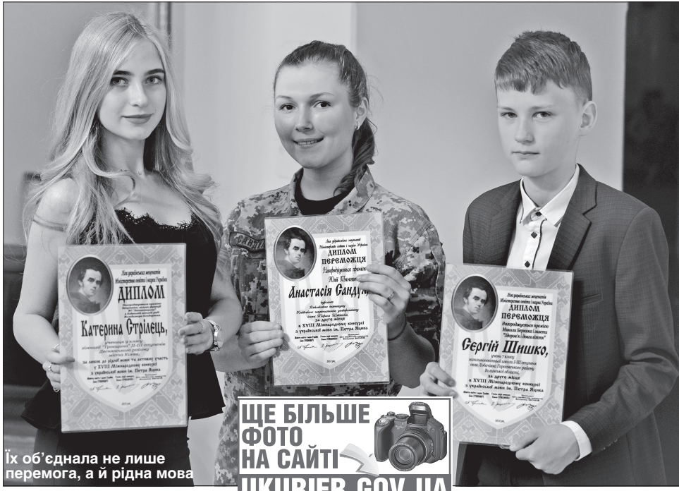
Їх об'єднала не лише перемога, а й рідна мова

Цей конкурс проводиться щороку та існує виключно завдяки українцям-меценатам з України та з-за кордону. Підтримав цей конкурс цього року й Президент України та чимало політиків. Адже він популяризує українську мову, робить її модною, і сприяє тому, аби мову вчили, любили та шанували. Бо, як слушно зауважила Ліна Костенко, «нації вмирають не від інфаркту, спочатку їм відбирає мову». Під час вручення премій український поет і видавець Іван Малкович наголосив на важливості таких конкурсів та особис-