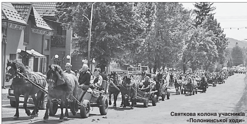
Святкова колона учасників «Полонинської ходи»

Потім на сцені почалися виступи виконавців. Творчістю з глядачам ділилися заслужений артист України Ігор Юрковський та гурт «Фанфари купали», співак і композитор Михайло Мод, творчі колективи і солісти Тячівського району, а також Ужгородського коледжу культури та мистецтва. Довкола стадіону були влаштовані виставки робіт народних умільців — майстрів декоративно-прикладного та образотворчого мистецтва. Всі учасники могли скуштувати та придбати знамениті сири — бринзу та вурду. Пастухи розповідали про вівчарське ремесло та демонстрували знаряддя своєї праці, для них влаштовували конкурси з професійної майстерності.