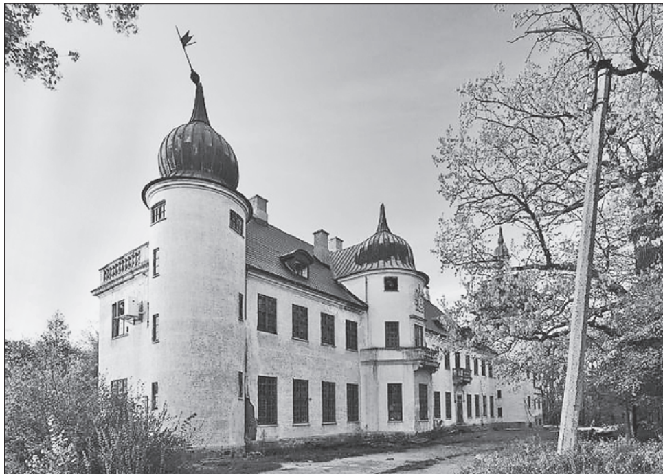
Палац уже більше не може чекати реставраторів-ремонтників

За радянських часів у мисливському замку були розміщені і школа, і будівельна організація, й музей хліборобства. Цікаво, що музей хліборобства тут влаштували у зв'язку з тим, що на території Тального знайдено багато залишків трипільської культури.