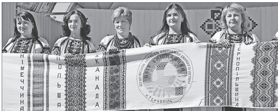
Представлення міжнародного вишитого рушника єднання «Цвіт вишиванки»