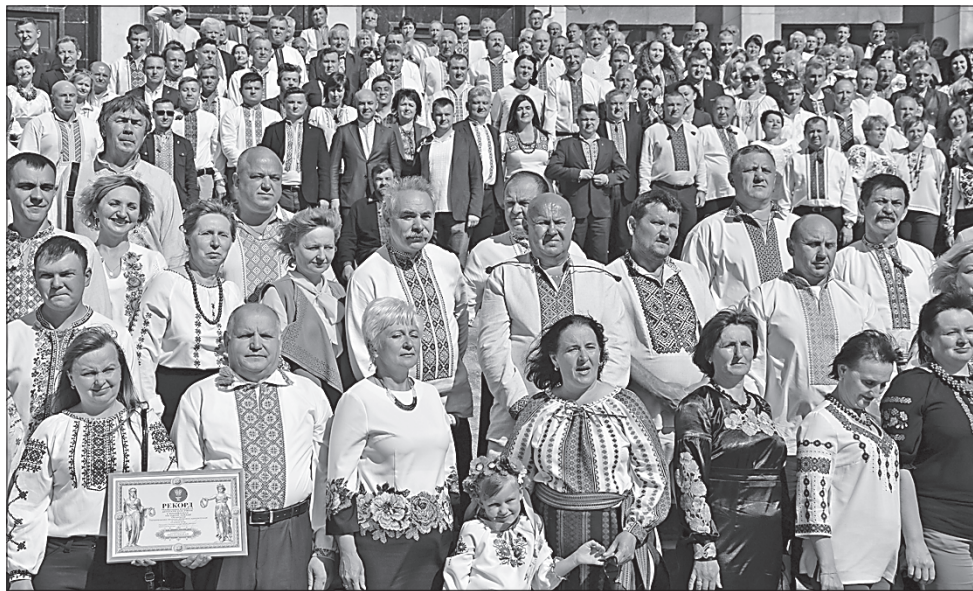
Депутати усіх рівнів вийшли на рекорд

На місці, де знайшли останки, розташовувався табір турецького війська. За масштабністю це поховання щонайменше трьох сотень осіб — безпрецедентна в Україні історична знахідка.