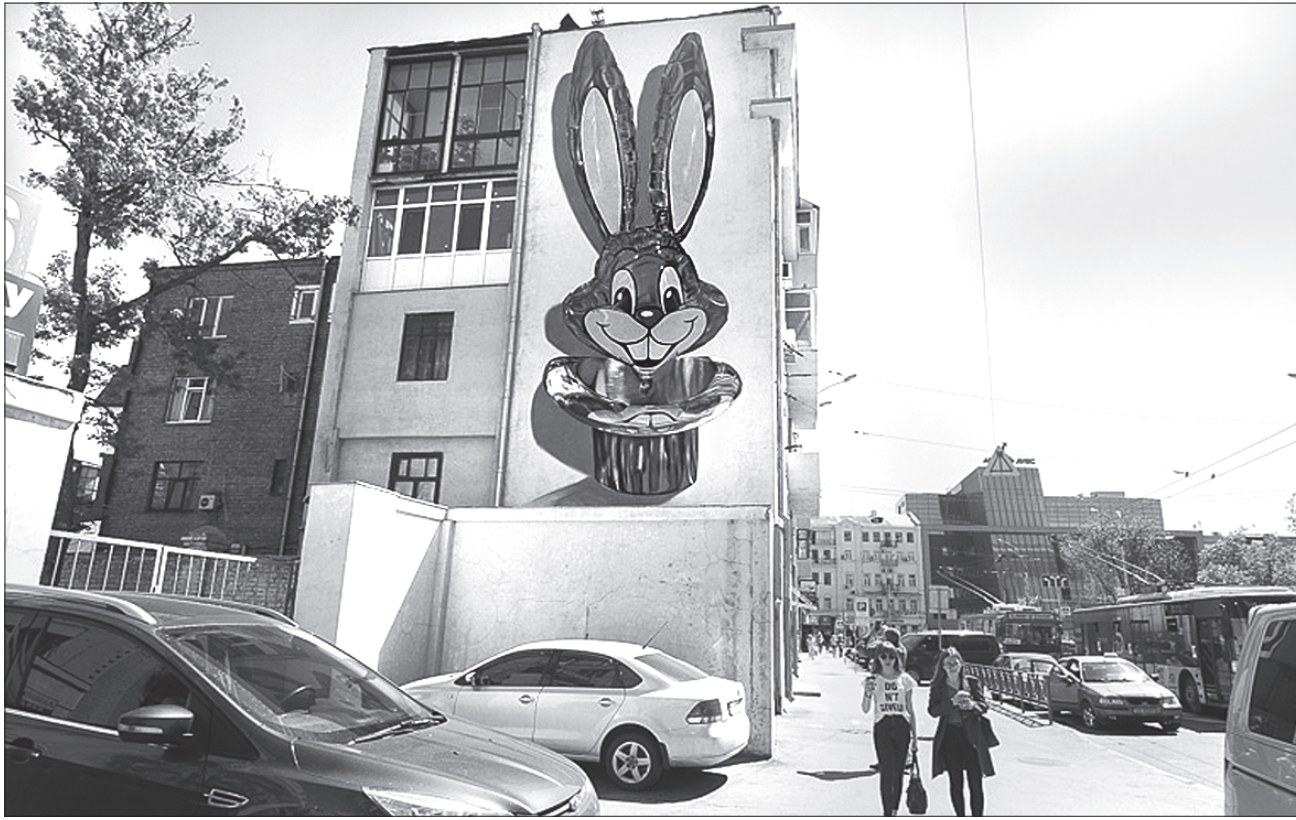
Вухасте диво і справді викликає усмішку в кожного перехожого...