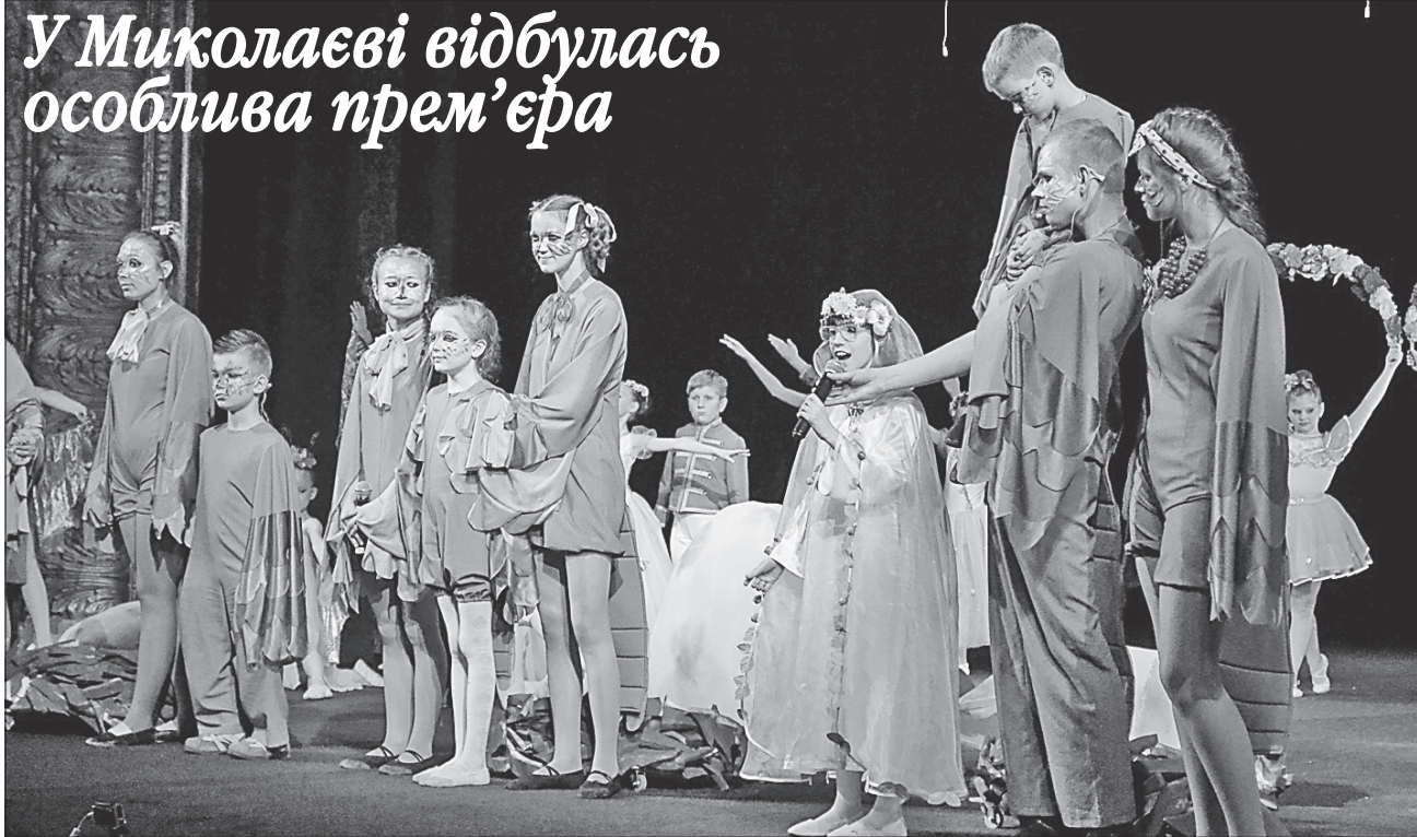
У виставі разом з професійними акторами ролі виконували діти з обмеженими можливостями