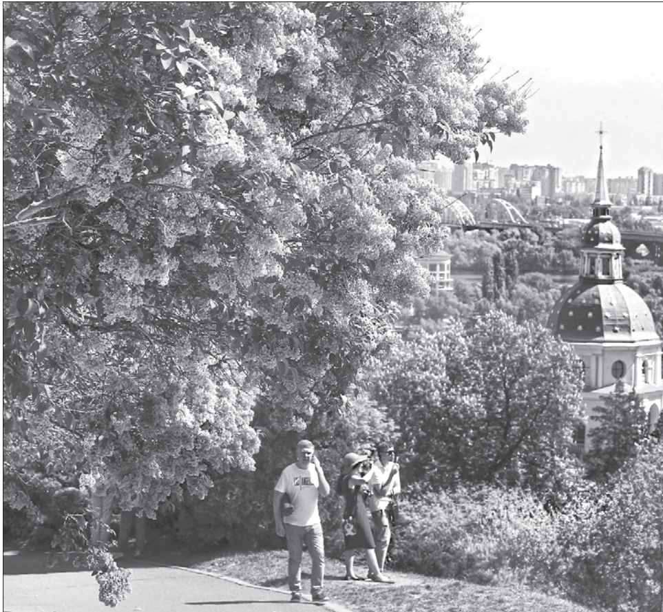
Цієї весняної пори бузковий рай приваблює тисячі людей

Щороку помилуватися красою бузкових суцвіть і насолодитися їхнім незвичайним ароматом до заповідника приїздять тисячі відвідувачів. Прогулюючись поміж квітучих кушчів, вони одержують заряд позитивної енергії, якого вистачає надовго. Щоб урізноманітнити відпочинок тих, хто насолоджу-