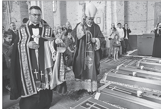
Останки членів родини Чарторийських перепоховали за католицьким обрядом