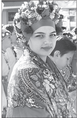
Іванка МІЩЕНКО для «Урядового кур'єра»

ТРАДИЦІЇ. В області відбувся фестиваль української культури і фольклору «Байбак-fest — 2018».