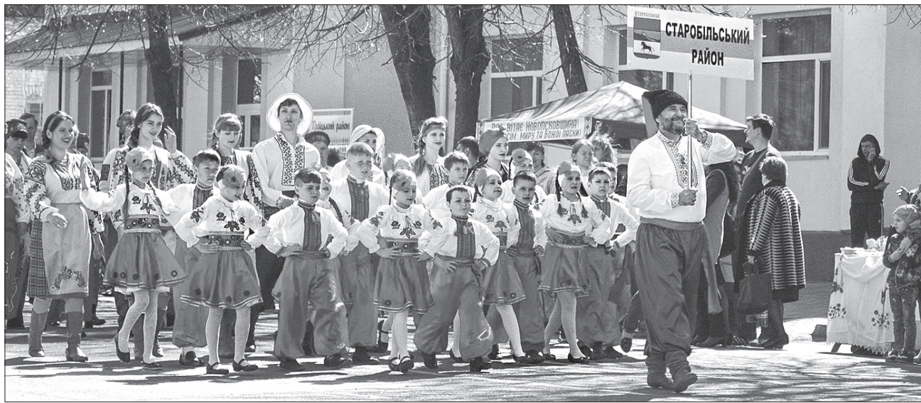
Учасники і глядачі раділи пісням та конкурсам фестивалю

Фестиваль-конкурс щосезону раз на два роки крокує містами й районами Луганщини, тож талановиті люди мають нагоду взяти участь у наступних трьох етапах щорічного «Байбак-fest» у прифронтових Попаснянському (літній етап), Станично-Луганському (осінній) та Новоайдарському (зимовий) районах.