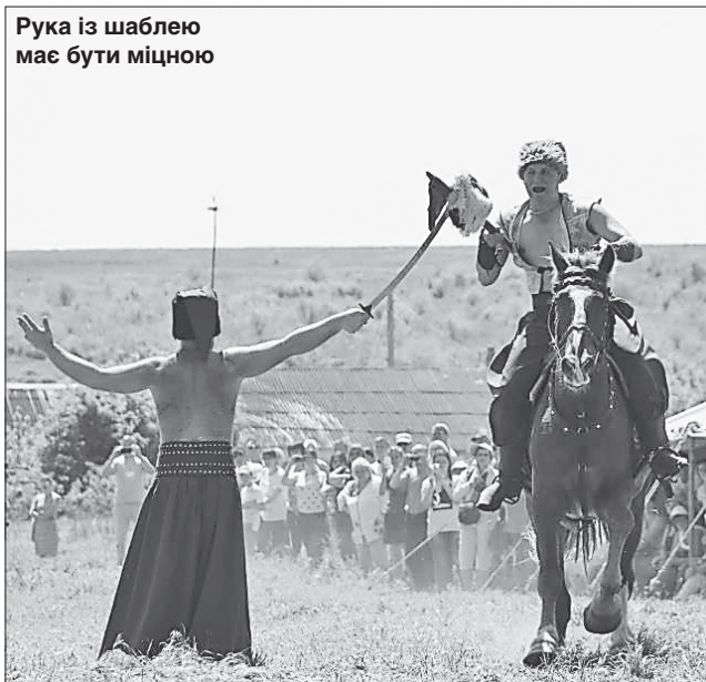
Рука із шаблею має бути міцною

варіантів відпочинку на будь-який смак і гаманець. Область багата на природні принади — Чорне та Азовське моря, найбільша в Європі пустеля, заповідники й національні парки з дикими тваринами. А когось привабить цей край виноробством, історією й козацькою славою. Херсонщина — це ідеальне місце для оздоровлення. Свої пропозиції представили вісім районів і чотири населених пункти області. Голопристанський район презентував потенціал Чорноморського узбережжя, цілющі озера, унікальний Чорноморський заповідник, Тендрівську і Ягорлицьку затоки. Програма свята була розрахована на різні смаки і вподобання, вікові категорії. 16 команд з різних міст взяли участь у другому Всеукраїнському чемпіонаті сухопутних військ України з функціонального багатоборства «Кросфіт». Школярі змагалися в різних видах спорту. Загальну атмосферу свята доповнили виступи музичних гуртів, самодіяльних колективів і кінного театру, демонстрація військової техніки, фестиваль національної їжі, повітряні кулі й багато інших заходів. Отже, туристичний сезон відкрився, а Херсонщина чекає на гостей у пошуках нових вражень та емоцій.