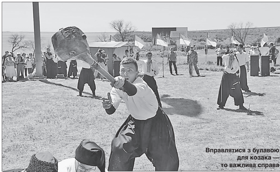
Вправлятися з булавою для козака — то важлива справа

Дослідження Кам'янської Січі розпочалися ще 100 років тому, коли херсонський землемір зроби