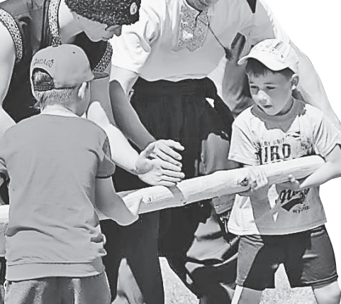
Глядачів зацікавили старовинні козацькі бойові традиції

б для історика Дмитра Яворницького план січі. Козаки осіли на Кам'янській Січі після втрати земель внаслідок Полтавської битви. Січ було зруйновано, територію зайняли російські війська, козаки разом з військом Карла XII та військом Мазепи відступили: частина у Бендери, частина осіла в Кам'янській та Олешківській Січі. Кам'янська Січ стала кордоном між козацькою землею і Кримським ханством. Тепер пам'ятка стала місцем історико-культурних фестивалів, новим