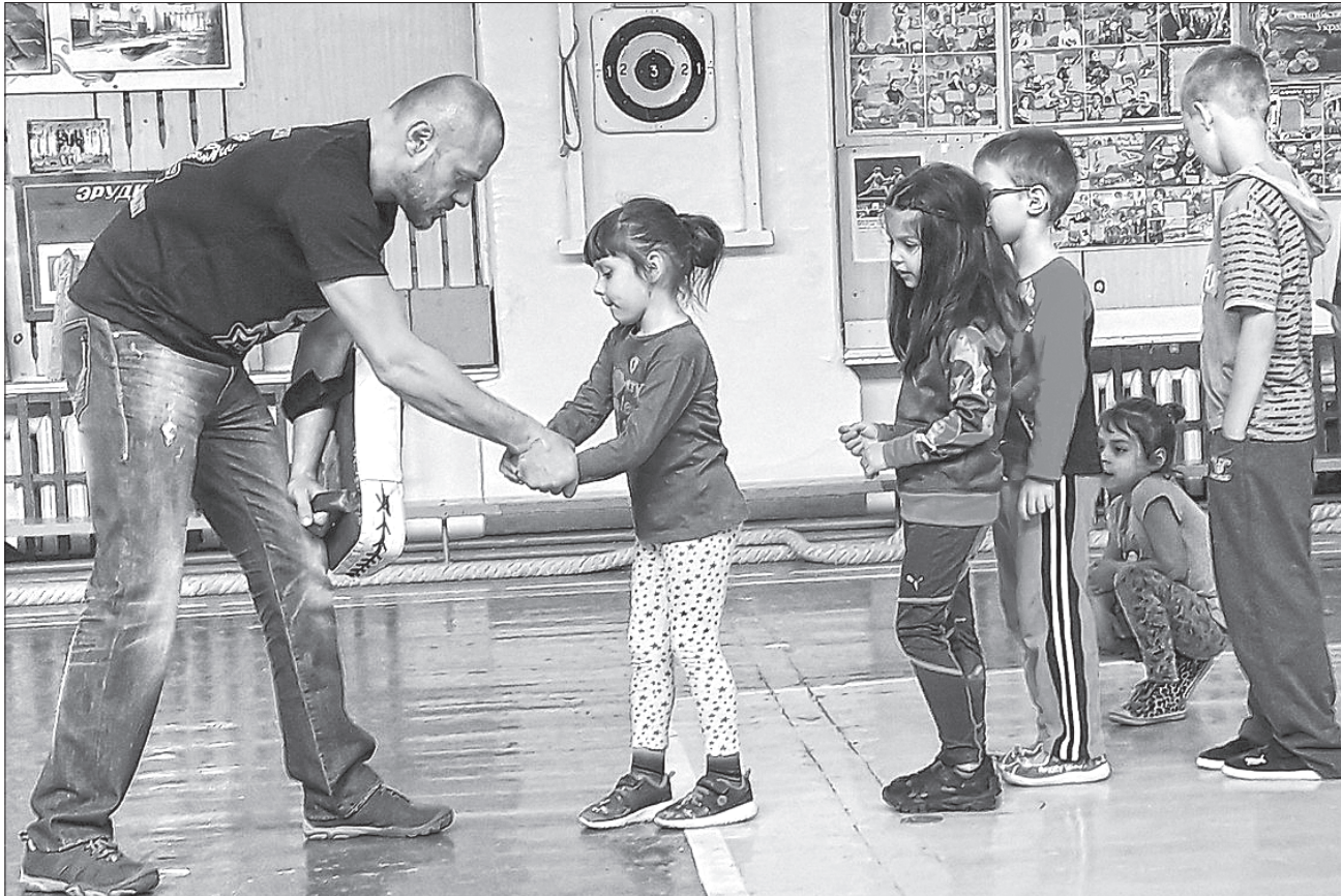
Тренер вчить дітей за особисто розробленою методикою